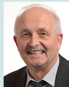
Partiformand Udo Bullmann

Som formand for partigruppen er det dit ansvar at lægge den overordnede politiske strategi. Du skal derfor diskutere med din særlige rådgiver hvilke partier, I ønsker at lave alliancer med. Som formand har du også det sidste ord, når det kommer til miljøpolitikken, men du lytter selvfølgelig til råd fra partigruppens medlem i miljøudvalget.