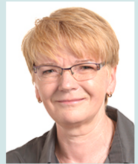
Formand Gabi Zimmer

Som formand for partigruppen er det dit ansvar at lægge den overordnede politiske strategi. Du skal derfor diskutere med din særlige rådgiver hvilke partier, I ønsker at lave alliancer med. Som formand har du også det sidste ord, når det kommer til miljøpolitikken, men du lytter selvfølgelig til råd fra partigruppens medlem i miljøudvalget.